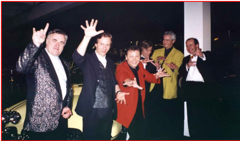
World Class Magic in Geneva, Musée L'Automobil, Kodak International Event:

Wir bringen die besten Tischzauberkünstler der Welt an Ihren Event. Erleben Sie Table Entertainment in einer neuen Dimension.